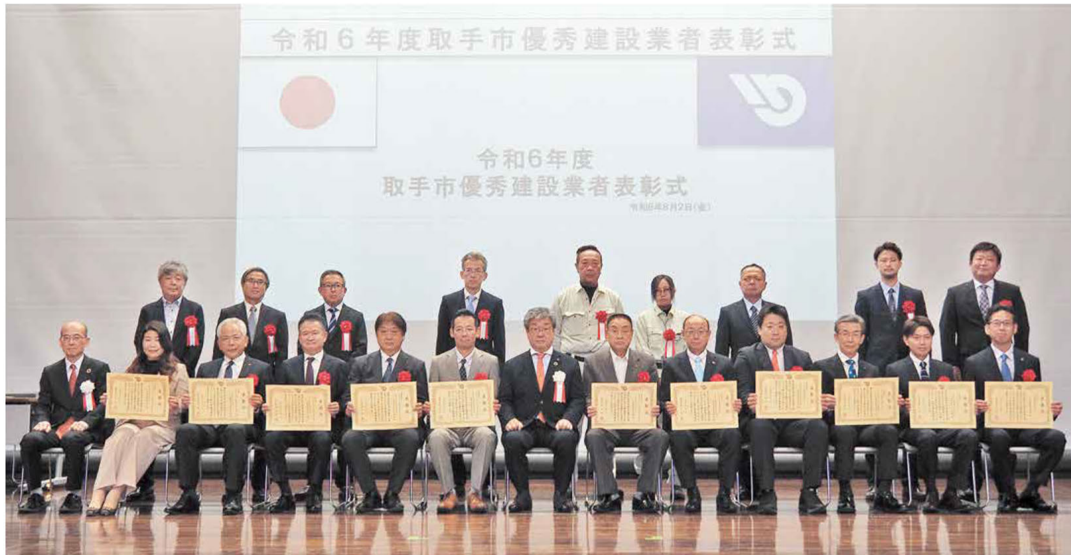
令和6年度取手市優秀建設業者表彰式