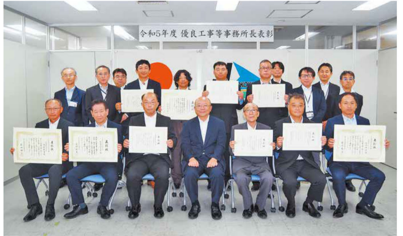
常総国道事務所長を囲み記念撮影