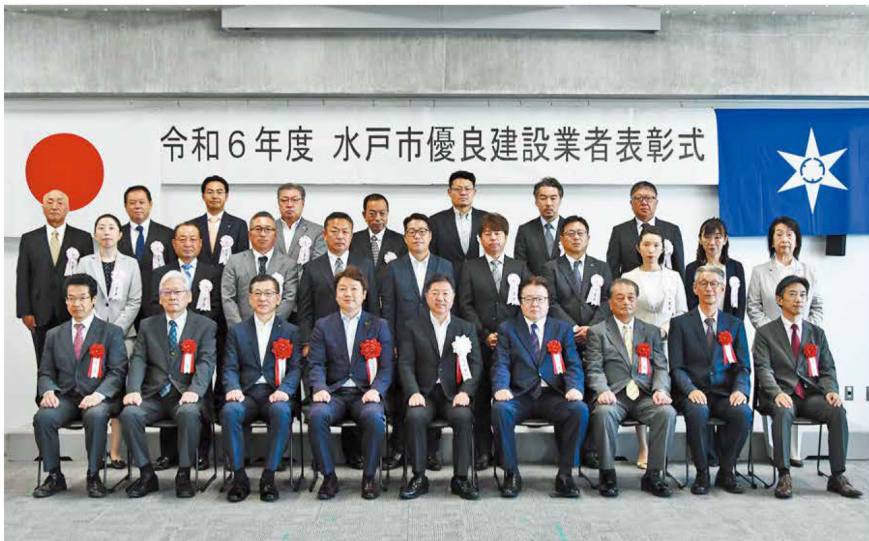
令和6年度 水戸市優良建設業者表彰式